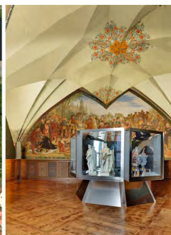
Trendsetter seit 1471