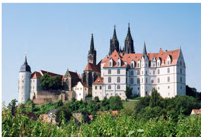
Burgberg mit Albrechtsburg Meissen und Dom

FÜHRUNG buchbar von April bis Oktober 2016, Montag bis Samstag, Anmeldung erforderlich. Kombi-Ticket für Führung 12,00 EUR p.P., ermäßigt 8,00 EUR p.P., Beginn 11:30 Uhr, Dauer 1.5 h. Optional: Führung ohne Teil Klang »Gottesburg & Fürstenpracht« 10,50 EUR p.P., ermäßigt 6,50 EUR p.P., ganzjährig buchbar, während der Öffnungszeiten. Touristische Infrastruktur: Busparkplätze vorhanden, Zugang zum Burgberg mit Aufzug möglich. Buchung von Übernachtungen über die Tourist-Info Meißen ( www.touristinfo-meissen.de ).