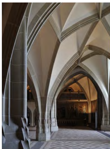
Großer Saal

FÜHRUNG ganzjährig buchbar, Ticket inkl. Führung 9,50 EUR p.P. Für Gruppen ab 15 Personen. Dauer 1 h. Führung durch einen Gästeführer ist vorab zu buchen. Aufteilung der Gruppe je nach Gruppenstärke möglich. Touristische Infrastruktur: Busparkplätze vorhanden, Zugang zum Burgberg mit Aufzug möglich. Buchung von Übernachtungen über die Tourist-Info Meissen. ( www.touristinfo-meissen.de )