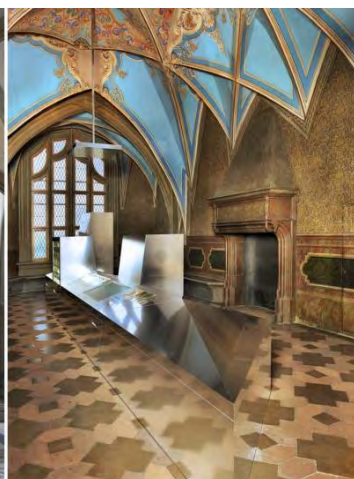
Trendsetter seit 1471