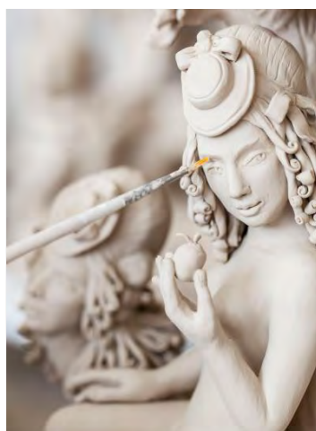
Erlebniswelt HAUS MEISSEN®