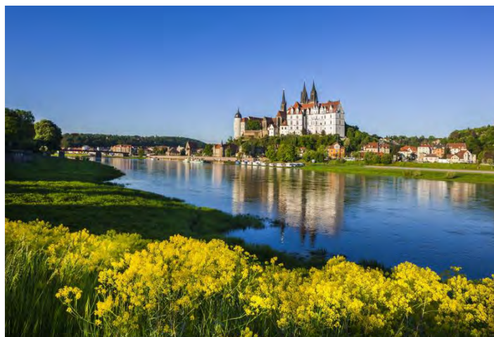
Blick zur Albrechtsburg Meissen