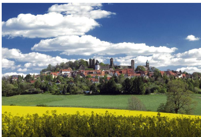
Die Burganlage über der Stadt Stolpen

FÜHRUNG ganzjährig buchbar, Sommerhalbjahr täglich, Winterhalbjahr Di.-So. und witterungsbedingt. Dauer ca. 1,5 h. Eintritt 10,00 EUR pro Person inkl. Führung. Gruppengröße 15 bis 40 Personen. Anmeldung erforderlich. Freier Eintritt für Busfahrer und Reiseleiter. Touristische Infrastruktur: Haltemöglichkeit für Busse und Parkplatz in 500 m. Cafeteria »Zehrgarten« in der Burg von April bis Oktober geöffnet. Eingeschränkt barrierefrei.