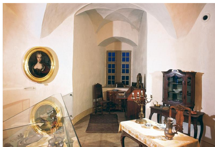
Johannisturm, Wohnzimmer der Gräfin Cosel