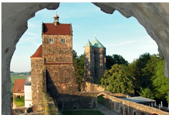
Die innere Burg mit Seiger- und Johannis-(Cosel-)turm

FÜHRUNG ganzjährig buchbar, Sommerhalbjahr täglich, Winterhalbjahr Di.-So. und witterungsbedingt. Dauer ca. 1,5 h. Eintritt 10,00 EUR pro Person inkl. Führung. Gruppengröße 20 bis 40 Personen. Anmeldung erforderlich. Freier Eintritt für Busfahrer und Reiseleiter. Touristische Infrastruktur: Haltemöglichkeit für Busse und Parkplatz in 500 m. Cafeteria »Zehrgarten« in der Burg von April bis Oktober geöffnet. Eingeschränkt barrierefrei.