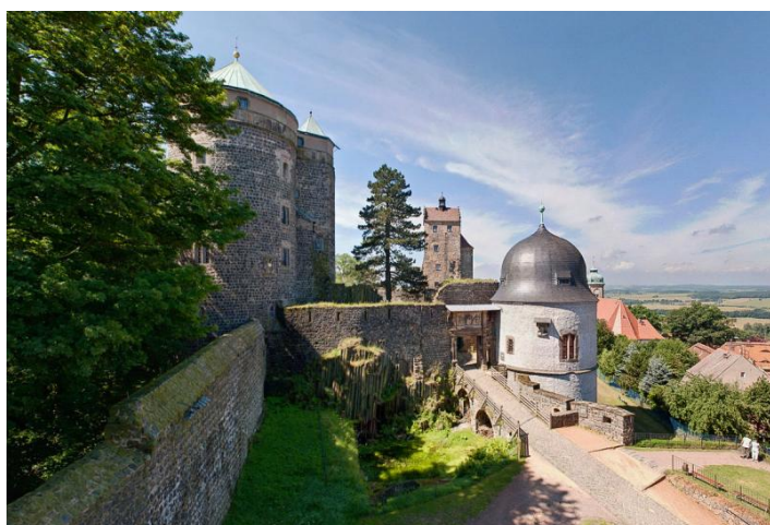
Blick in den 2. Burghof mit seinen markanten Türmen

FÜHRUNG ganzjährig buchbar, Sommerhalbjahr täglich, Winterhalbjahr Di.-So. und witterungsbedingt. Dauer ca. 1,5 h. Eintritt 10,00 EUR pro Person inkl. Führung. Gruppengröße 15 bis 40 Personen. Anmeldung erforderlich. Freier Eintritt für Busfahrer und Reiseleiter. Touristische Infrastruktur: Haltemöglichkeit für Busse und Parkplatz in 500 m. Cafeteria »Zehrgarten« in der Burg von April bis Oktober geöffnet. Eingeschränkt barrierefrei.