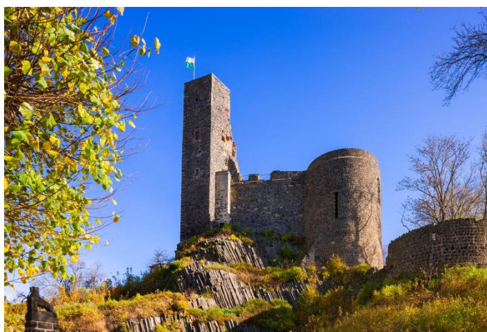
Burg Stolpen im Herbst

FÜHRUNG ganzjährig buchbar, Sommerhalbjahr täglich, Winterhalbjahr Di.-So. und witterungsbedingt. Dauer ca. 1,5 h. Eintritt 10,00 EUR pro Person inkl. Führung. Gruppengröße 15 bis 40 Personen. Anmeldung erforderlich. Freier Eintritt für Busfahrer und Reiseleiter. Touristische Infrastruktur: Haltemöglichkeit für Busse und Parkplatz in 500 m. Cafeteria »Zehrgarten« in der Burg von April bis Oktober geöffnet. Eingeschränkt barrierefrei.