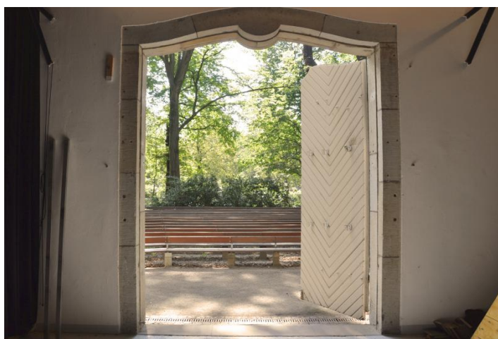
Das Sonnenhäusel im Großen Garten