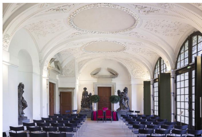
Trauungen im Palais