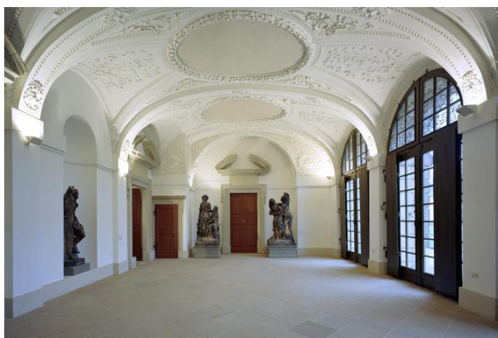
Palais Großer Garten (Langsaal)