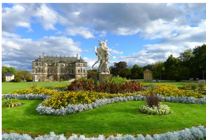
Das Palais im Großen Garten