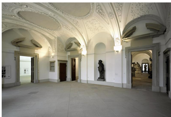
Palais im Großen Garten - Langsaal