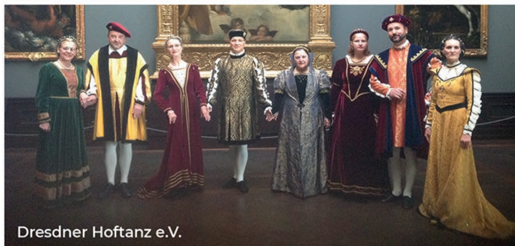
Dresdner Hoftanz e.V.