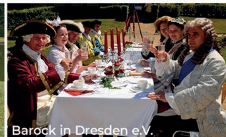
Barock in Dresden e.V.