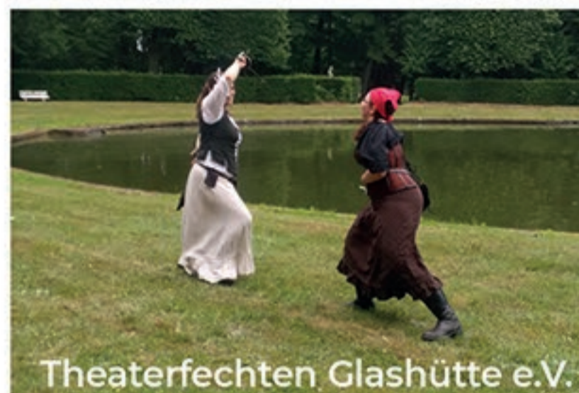
Theaterfechten Glashütte e.V.