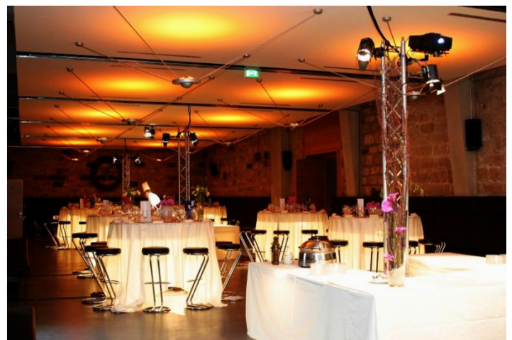
Weinkeller mit Barhockern