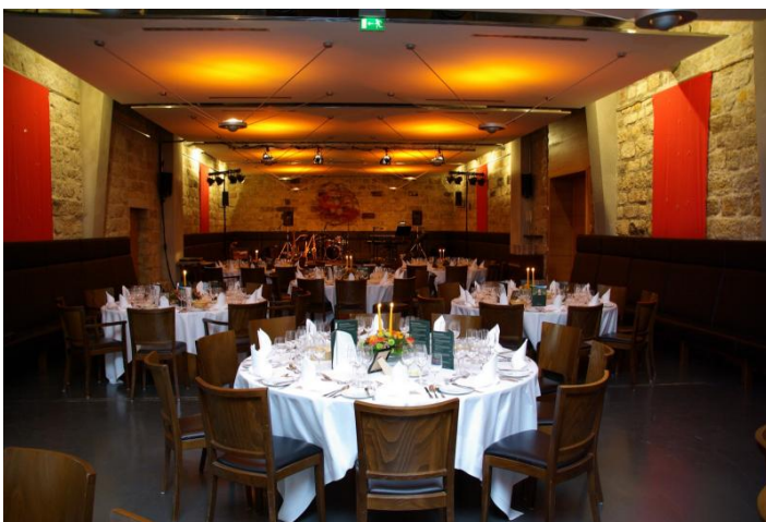
Weinkeller mit Bankettbestuhlung

800,00 Euro Sandsteingewölbe & Weinkeller: 1.200,00 Euro Die Raummieten sind abhängig vom getätigten Speise- und Getränkeumsatz und werden gegebenenfalls angepasst. Nebenkosten: Personal, Speisen- und Getränke