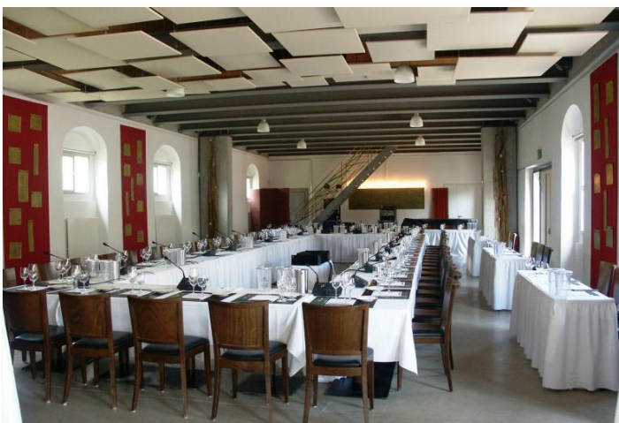
Vinothek mit Konferenzausstattung

Nebenkosten: Personal, Speisen- und Getränke