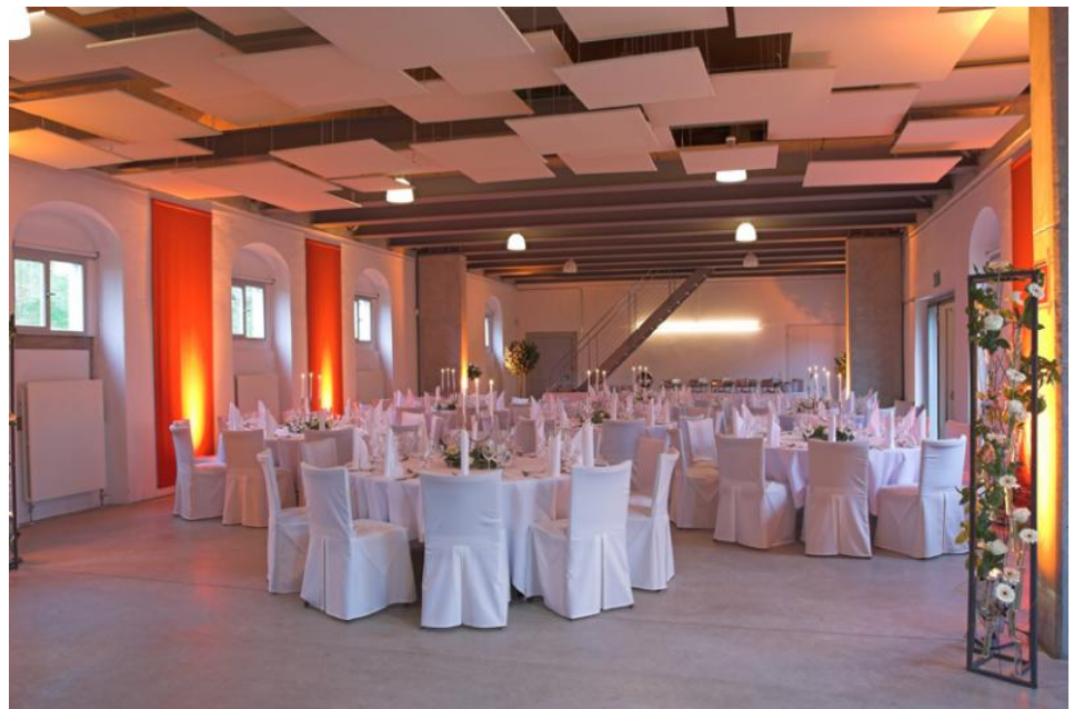
Vinothek mit Bankettbestuhlung