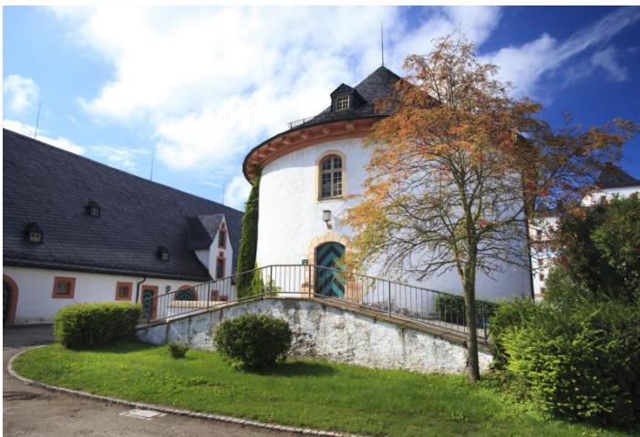
Brunnenhaus im Wirtschaftshof

Nutzungsgebühr pro Trauung inkl. Deko, Parkgenehmigungen: 220,- Euro inkl. USt.