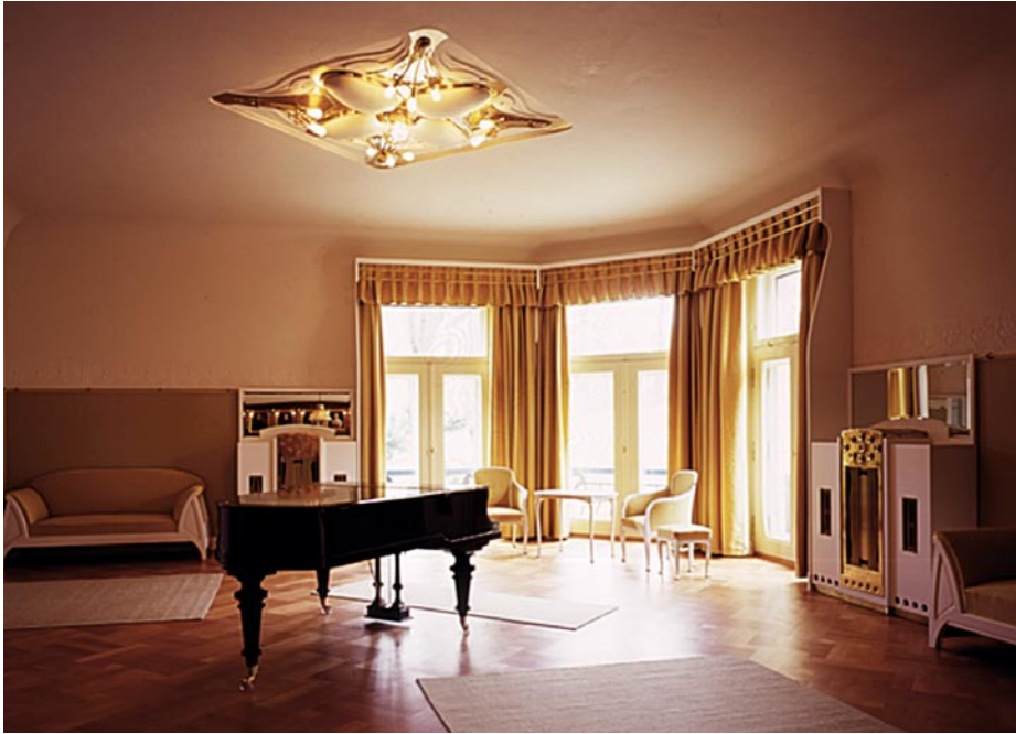
Der Musiksalon der Villa Esche