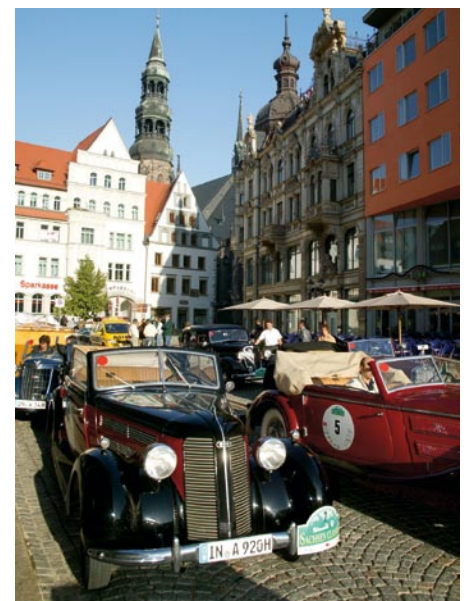
„Sachsen Classic“ in Zwickau