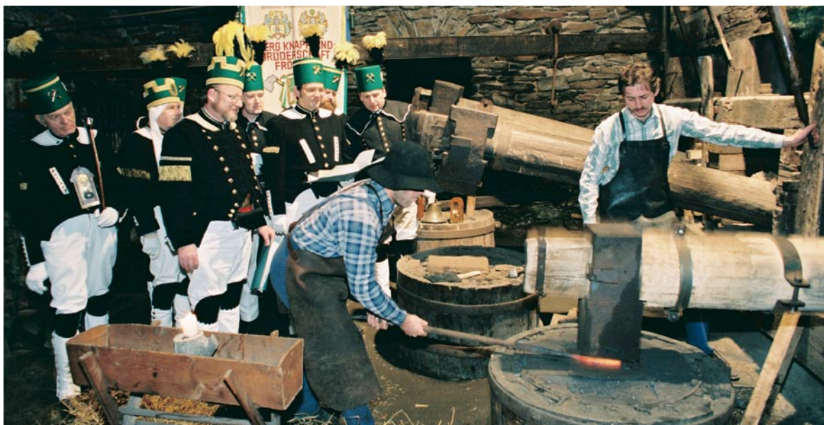
Der Frohnauer Hammer

Zentrum der sächsischen Industrie – Das Industriemuseum Chemnitz macht die sächsische Industriegeschichte nacherlebbar. Hier kann man nicht nur bedeutende sächsische Erfindungen wie den Kaffeefilter, die Spiegelreflexkamera und das Feinwaschmittel entdecken, sondern auch eine alte Dampfmaschine fauchen hören. Im einstigen Kloster und späteren Schloss auf dem Schlossberg ist heute ein Museum. Unter den Chemnitzer Fabrikantenvillen ragt die Residenz von Herbert Esche heraus, die Henry van de Velde als Gesamtkunstwerk des Jugendstils gestaltete. Eigenwillig sieht auch das Wasserschloss Klaffenbach am südlichen Stadtrand aus.