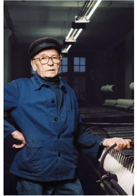
Das Westsächsische Textilmuseum