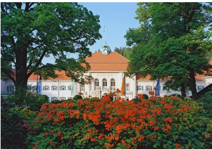
Der Kurpark Bad Elster

Fahrradtour: Länge ca. 115 Kilometer www.schloesserland-sachsen.de