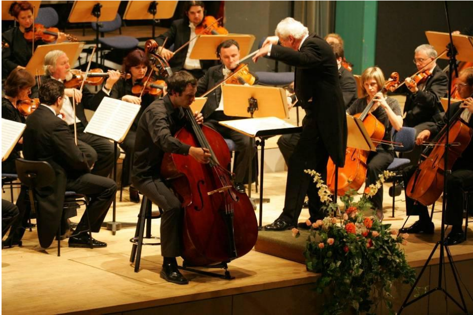
Instrumentalwettbewerb in Markneukirchen