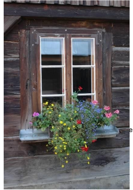
Fenster eines Umgebendehauses