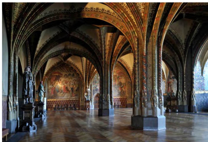
Die Große Hofstube der Albrechtsburg Meissen