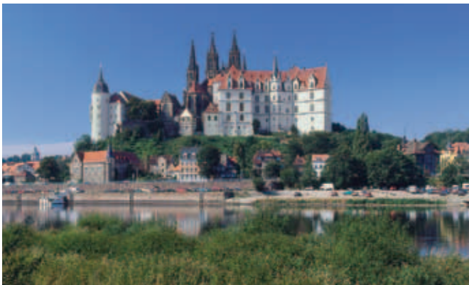
Der Meißner Burgberg mit Schloss und Dom