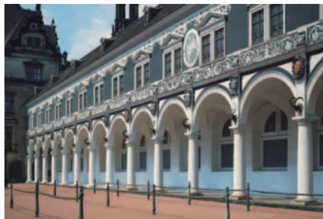
Reich verzierte Fassade mit Sonnenuhr

ANFAHRT A4 Abfahrt Dresden-Altstadt, Richtung Stadtzentrum, Gläserne Manufaktur oder Zoo ÖFFNUNGSZEITEN Garten frei zugänglich | Palais: So 14:30 Uhr im Rahmen von Führungen Die Fahrzeiten der Parkeisenbahn erfahren Sie unter Telefon +49 (0) 351 44 56-795 oder www.parkeisenbahn-dresden.de