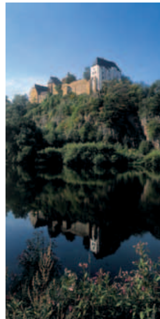
Die Burganlage mit Freiburger Mulde

Bei untergehender Sonne wirkt die Burg Mildestein, von der Freiburger Mulde aus gesehen, wie ein altes Gemälde – weich liegt sie auf einem Porphyrfelsen am Rande des beschaulichen Ortes Leisnig. Nichts ist zu spüren von den rohen Foltermethoden, die Gefangene hier erleiden mussten. Eine Ausstellung und die Gefangenzellen erinnern an diese Zeit. Ein Meisterwerk mittelalterlicher Zimmermannskunst ist die Dachkonstruktion des Kornhausbodens. Vom imposanten Bergfried hingegen genießt man einen herrlichen Rundblick über Leisnig und das Muldental. Eine neue Dauerausstellung gibt Einblick in das Alltagsleben hinter den mächtigen Burgmauern und erzählt von der Zeit als Residenz und wettinisches Amt.