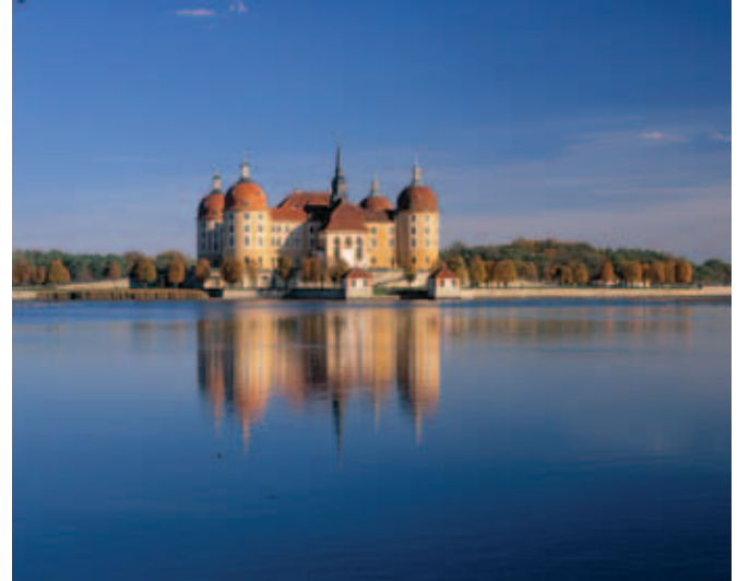
Schloss mit Teichlandschaft