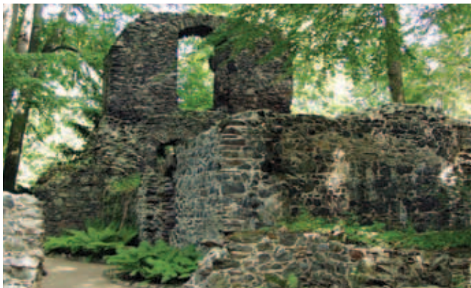
Die Abtei im Klosterpark