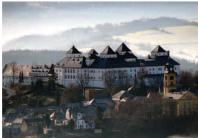
Die Stadt Augustusburg mit Schloss

Diese bedeutende Renaissance-Anlage wird wegen ihrer Monumentalität und ihrer Schönheit auch »Krone des Erzgebirges« genannt. Einst von Kurfürst August als Jagd- und Lustschloss errichtet, bietet Schloss Augustusburg heute drei Museen Platz: dem Kutschenmuseum, dem Motorradmuseum und dem Museum für Jagdtier- und Vogelkunde. Vom Aussichtsturm eröffnet sich dem Besucher ein fulminanter Blick über das Erzgebirge, und bei einer Führung bieten sich ihm geheimnisvolle Einblicke hinter die vielen Türen dieser reizvollen Schlossanlage.