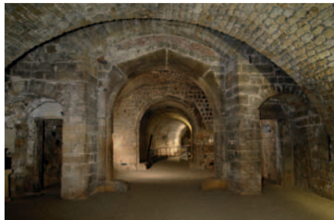
Kasematten unter der Brühlschen Terrasse

Unter dem »Balkon Europas«, der Brühlschen Terrasse, liegt mit der Festung der wohl älteste erhaltene Teil Dresdens. Einst als Mauerring angelegt und von einem breiten Wassergraben umgeben, findet man neben dem 400 Jahre alten Ziegeltor, dem letzten erhaltenen Stadttor Dresdens, die historischen Überreste mittelalterlicher Wehranlagen, die alte Stadtbrücke, die kleine Bastion, die berühmten Kasematten und vieles mehr. Geheimnisvolle Gewölbe entführen in eine scheinbar unterirdische Welt, die anhand von Modellen veranschaulicht zeigt, wie sich Dresden einstmalig vor Feinden schützte.