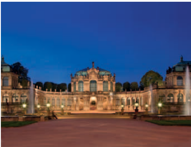
Innenhof des Dresdner Zwingers

»Alte Meister«, das Glockenspiel aus Meissener Porzellan, das versteckte Nymphenbad und eine der ältesten naturwissenschaftlich-technischen Sammlungen der Welt faszinieren jährlich mehrere Millionen Besucher.