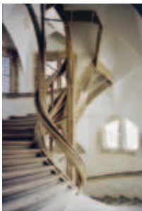
Der Große Wendelstein

Die Albrechtsburg Meissen ist das erste Schloss der deutschen Baugeschichte. Der Baumeister Arnold von Westfalen verwirklichte hier neuartige Elemente der Architektur wie die Vorhangbogenfenster und die beeindruckenden Zellengewölbe. Als ein besonderes Meisterwerk dieses spätgotischen Juwels sächsischer Elbschlösser gilt der »Große Wendelstein«. Berühmt ist die Albrechtsburg auch durch Johann Friedrich Böttger und Ehrenfried Walther von Tschirnhaus, die das europäische Porzellan erfanden. Die erste Porzellanmanufaktur Europas hatte anschließend hier ihren Sitz. Dem Besucher eröffnet sich mit Ausstellungen auf allen drei Etagen ein wahres Bilderbuch sächsischer Geschichte.