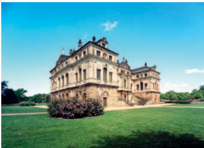
Palais im Großen Garten

In eine weitläufige Oase der Entspannung taucht ein, wer sich in den »Großen Garten« begibt. Eingebettet in eine wunderschöne Parklandschaft befinden sich das Palais, die Freilichbühne »Junge Garde« und das Parktheater. Bei einer Gondelpartie auf dem Carolasee oder einer Fahrt mit der Parkeisenbahn bekommt man einen Eindruck davon, wie ein Landschaftspark im englischen Stil und ein barocker Lustgarten nach französischem Vorbild miteinander harmonieren.