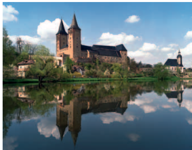
Das Schloss mit Zwickauer Mulde

lich das Leben auf einer spätmittelalterlichen Burg. Nicht verpassen sollte man die Schlossküche aus dem 14. Jahrhundert, die rekonstruierte Türmerwohnung in 34 Metern Höhe und das finstere Verlies. Beeindruckend ist die lebensgroße Nachbildung des »Dresdner Fürstenzuges«, einer einmaligen Genealogie sächsischer Herrscher.