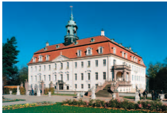
Das Schloss mit Mittelgarten

unter der thematischen Klammer »Begegnungen der Kulturen« den Zivilisationen Asiens und Afrikas widmen. Auch dem Scherenschnitt-Museum mit seinen filigranen zweidimensionalen Preziosen sollte man unbedingt eine Aufwartung machen – es zählt zu den ganz wenigen seiner Art in Deutschland.