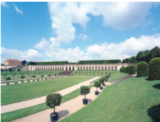
Die Untere Orangerie

Der Barockgarten Grosssedlitz ist der großartigste Garten Augusts des Starken – eigenwillig, sehr harmonisch mit Blumenrabatten, Orangerieparterres, vielfältigen Wasserspielen und Skulpturen von Göttern der Antike. Im französischen Gartenstil und von Italien inspiriert, gelang eine außergewöhnliche Gestaltung. Letztlich aber blieb Grosssedlitz unvollendet. Akuter Geldmangel am traditionell ausgabefreudigen Dresdner Hof ließ die schöpferische Phantasie an der monetären Realität scheitern. In den Sommermonaten wird der »Festsaal im Grünen« durch hunderte Orangen- und Feigenbäume aus der Toskana geschmückt.