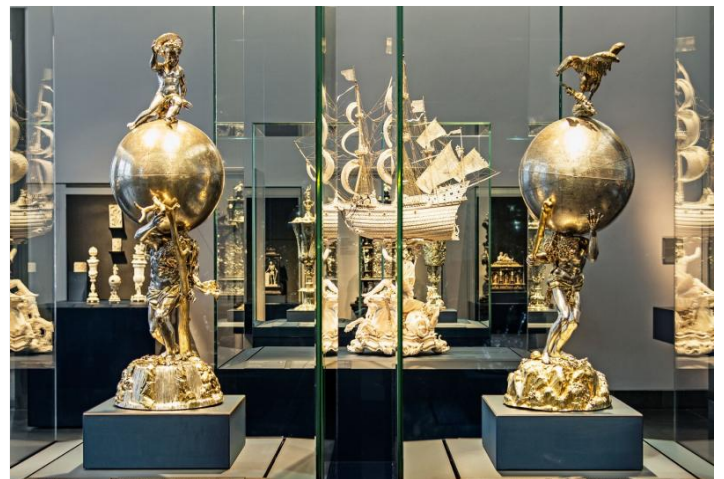
Neues Grünes Gewölbe