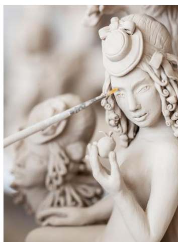
Erlebniswelt HAUS MEISSEN®