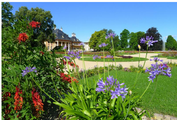
Blütenimpressionen im Lustgarten

FÜHRUNG von Juni bis September 2016 buchbar, Dauer nach individuellem Wunsch 1.5 h bzw. 2 h, Eintritt 7,00 EUR zzgl. Führung pauschal 50,00 EUR (1.5 h) bzw. pauschal 60,00 EUR (2 h), Gruppengröße bis 25 Personen. Anmeldung erforderlich. Freier Eintritt für Busfahrer und Reiseleiter (ab 10 Personen). Touristische Infrastruktur: Bushaltemöglichkeit/ Parkplatz für den Bus am Eingang Besucherzentrum »Alte Wache«. Gastronomische Lokalität z.B. im Schlosshotel Dresden-Pillnitz. Weitere Angebote auf Nachfrage. Nach Absprache barrierefrei.