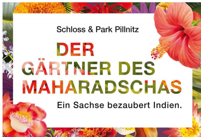
Themenjahr 2016 »Der Gärtner des Maharadschas«