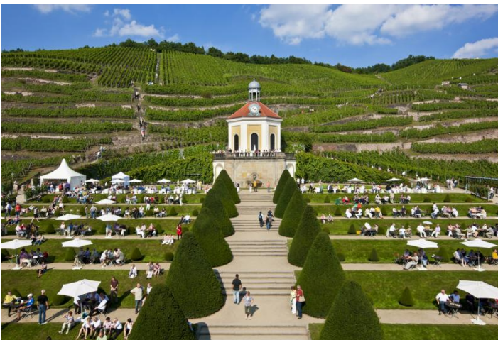
Das Belvedere von Schloss Wackerbarth

ANGEBOT ganzjährig buchbar. Wein- & Sekt-Führung mit 3er-Verkostung 12,00 EUR p. P. für Gruppen ab 15 Personen. Kostenfreie Teilnahme für Busfahrer und Reiseleiter. Optional mit saisonalem Mittag- oder Abendessen bzw. Kaffeetrinken kombinierbar. Weitere Angebote auf Anfrage. Touristische Infrastruktur: Haltemöglichkeit für Busse direkt vor der Manufaktur. Ausreichend Busparkplätze vorhanden. Barrierefrei.