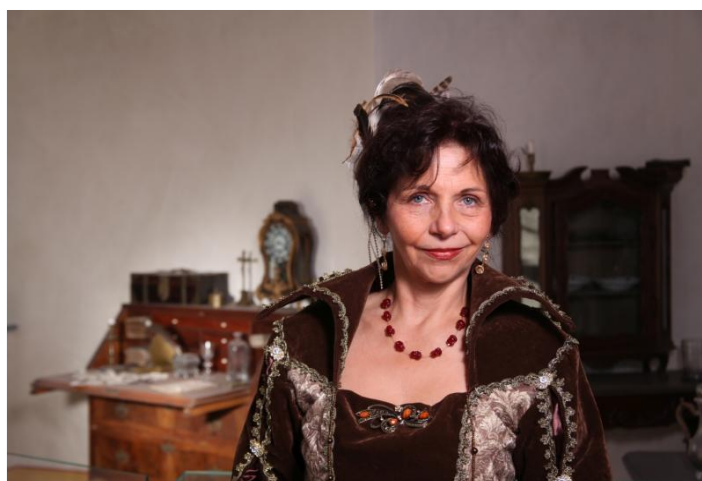
Gräfin Cosel im Coselturm