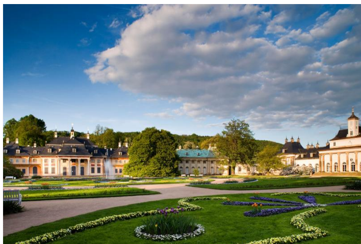
Schloss & Park Pillnitz

ANGEBOT ganzjährig buchbar, Dauer ca. 1.5 h, Eintritt und Führung 18,00 EUR p.P. Gruppengröße mind. 20 Personen. Anmeldung erforderlich. Reiseleiter kostenfrei. Touristische Infrastruktur: Bushaltemöglichkeit/Parkplatz für den Bus am Eingang Besucherzentrum »Alte Wache«. Gastronomische Lokalität im Schlosshotel Dresden-Pillnitz. Weitere Themen-, Schloss- und Parkführungen auf Nachfrage. Nach Absprache barrierefrei.