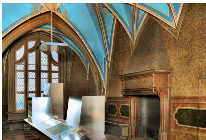
Trendsetter seit 1471

Eintritt, Besichtigung und Führung durch die Albrechtsburg Meissen und die Erlebniswelt HAUS MEISSEN® zum Gruppentarif (ab 15 Personen) 20,00 EUR p.P., inklusive betreuter Gästeführung 1h durch die Stadt Meißen zum jeweils anderen Objekt (Rundgang oder Busbegleitung). Beginn der Tour ist in der Albrechtsburg Meissen oder in der Erlebniswelt HAUS MEISSEN® möglich. Fremdsprachige Führungen auf Anfrage. Touristische Infrastruktur: Barrierefreier Zugang, Busparkplätze vorhanden.