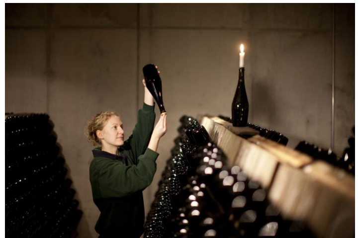
Schloss Wackerbarth führt die handwerkliche Kunst der traditionellen Flaschengärung meisterhaft fort.