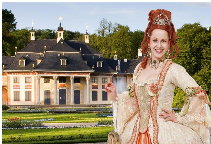
Führung mit gewandeter Schauspielerin