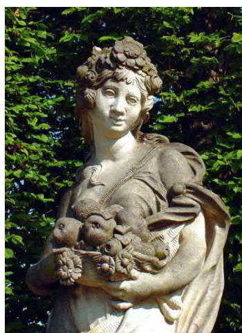
Die Pomona und ein Blick in den Park