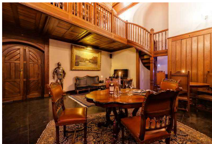
Blick in die Bibliothek