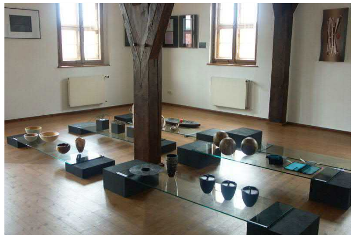
Gestaltung und Handwerk im Wasserschloß Klaffenbach