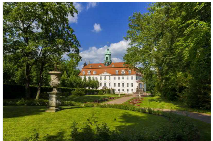
Schloss & Park Lichtenwalde, (c) ASL Schlossbetriebe gGmbH/ Dittrich