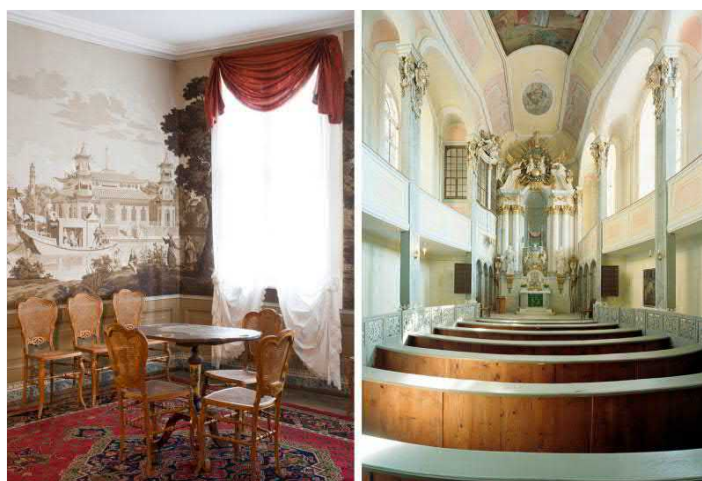
Chinesischer Salon im Schloss (links) und Blick auf den Kanzelaltar in der Schlosskapelle (rechts)