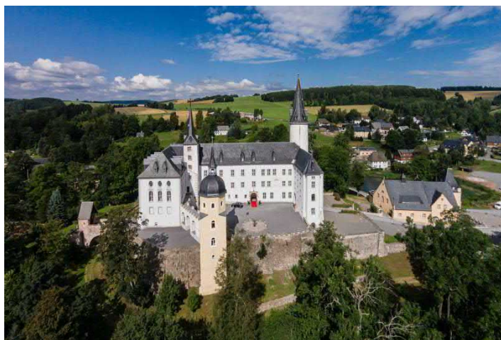
Schloss Purschenstein aus der Luft

ANGEBOT buchbar mit Anreise Sonntag bis Dienstag. Wochenende und Feiertage ausgeschlossen. Gesamtpreis 139,00 EUR p.P. in einem Vier-Sterne-Schlosshotel. Für Gruppen von 20 bis 30 Personen. Zuschlag DZ als EZ 20,00 EUR pro Nacht/ Zimmer. Nutzung des hoteleigenen Wellnessbereichs (Pool, Sauna) inklusive. Großer Parkplatz vorhanden.