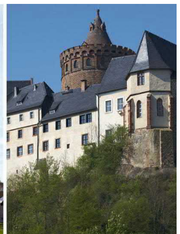
Ostseite mit Kapelle