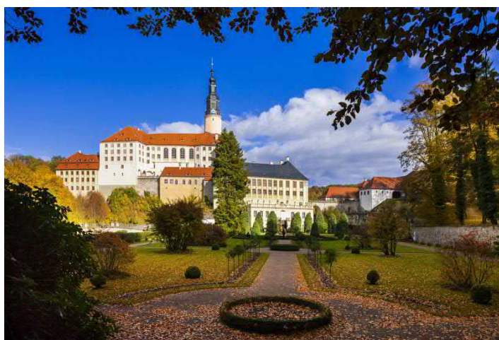
Blick auf Schloss Weesenstein

FÜHRUNG ganzjährig buchbar, Dauer ca. 1.5 h, Eintritt und Schlossführung 4,50 EUR p. P. für Gruppen von 15 bis 40 Personen zzgl. Führungsgebühr 40,00 EUR, Orgelspiel 25,00 EUR, Fassanstich mit Verkostung 5,00 EUR p. P., Anmeldung erforderlich. Weitere Angebote auf Anfrage. Freier Eintritt für Busfahrer und Reiseleiter (ohne Verzehr). Touristische Infrastruktur: Haltemöglichkeit für Busse vor dem Schlossberg und Parkplatz in 150 m Entfernung, Schlosspark, Gastronomie. Nicht barrierefrei.