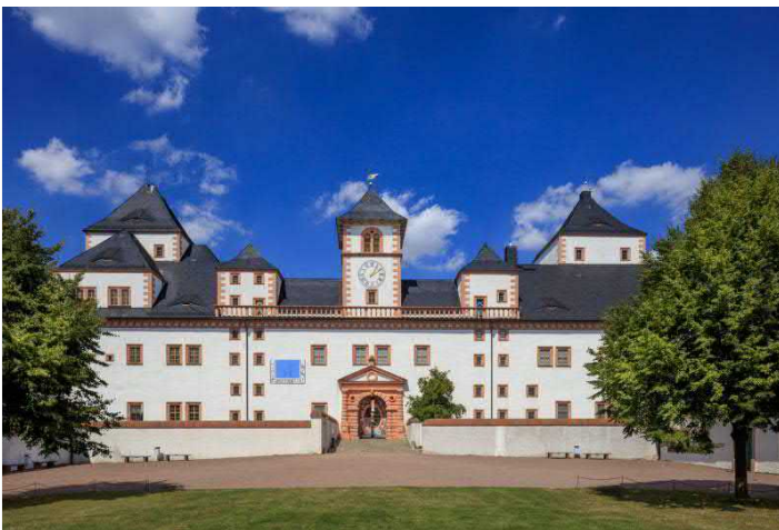
Schloss Augustusburg, (c) ASL Schlossbetriebe gGmbH/ Weisflog

ANGEBOT buchbar von April - Oktober (außer montags), Beginn 10:00 Uhr im Schloss Augustusburg, Dauer ca. 3 h, Preis 12,00 EUR p.P., Gruppengröße 20 bis 40 Personen. Buchbare Zusatzleistungen: Falkner-Show im Schloss Augustusburg 7,00 EUR p.P., Museumsbesuch im Schloss Augustusburg 10,00 EUR p.P., Schloss- und Museumsbesuch Lichtenwalde 6,00 EUR p.P. Freier Eintritt für Busfahrer und Reiseleiter. Zeitanpassungen möglich. Eingeschränkt barrierefrei. Übernachtungsmöglichkeit im Best Western Hotel am Schlosspark ( www.hotel-lichtenwalde.de ).