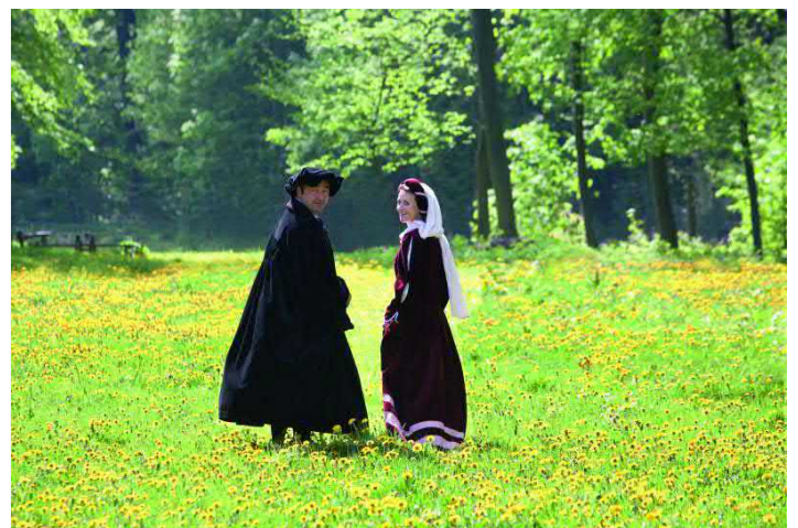
Auf den Spuren von Katharina von Bora und Dr. Martin Luther