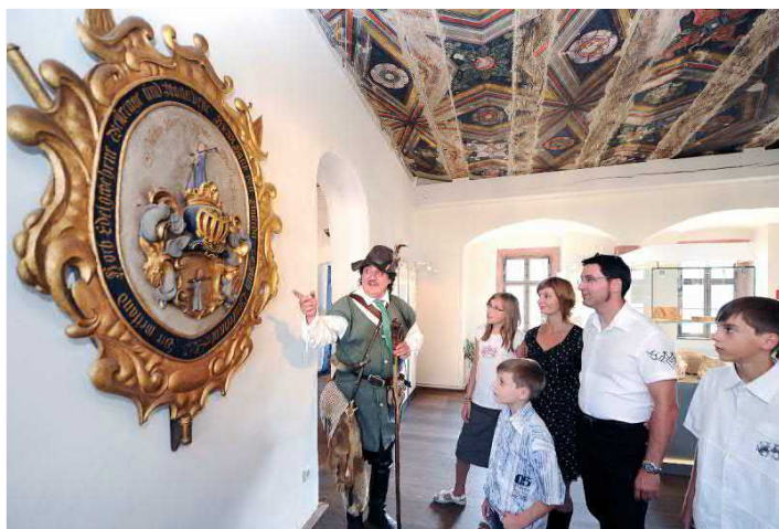
Mit Karl Stülpner durch die Burg

ANGEBOT ganzjährig buchbar (außer Schließzeit Januar), Beginn 10:00 Uhr, Dauer ca. 2 h, Preis 10,00 EUR p. P., Gruppengröße 15 bis 40 Personen. Anmeldung erforderlich. Buchbare Zusatzleistungen: Mittagessen inkl. 1 Getränk (alkoholfrei oder kleines Bier) in der Burgschänke 12,50 €, Kaffeetrinken mit Torte und Kaffee 4,50 EUR p.P. Zeitanpassungen möglich. Freier Eintritt für Busfahrer und Reiseleiter. Touristische Infrastruktur: nicht barrierefrei.