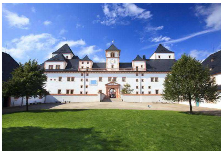
Südseite Schloss Augustusburg

ANGEBOT ganzjährig buchbar, Dauer ca. 90 min, Preis 12,00 EUR p.P. (ab 15 P.) / 10,00 EUR p.P. (ab 20 P.), Gruppengröße 15 bis 25 Personen (größere Gruppen müssen geteilt werden und starten zeitlich leicht versetzt). Freier Eintritt für Busfahrer und Reiseleiter, sowie Kaffee gratis in der Schlossgastronomie. Ungeeignet für Rollstuhlfahrer und gehbehinderte Menschen. Die Räume der Erlebnistour sind nicht beheizt. Zwei Busparkplätze direkt am Schloss.