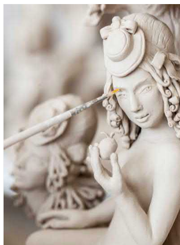
Erlebniswelt HAUS MEISSEN®