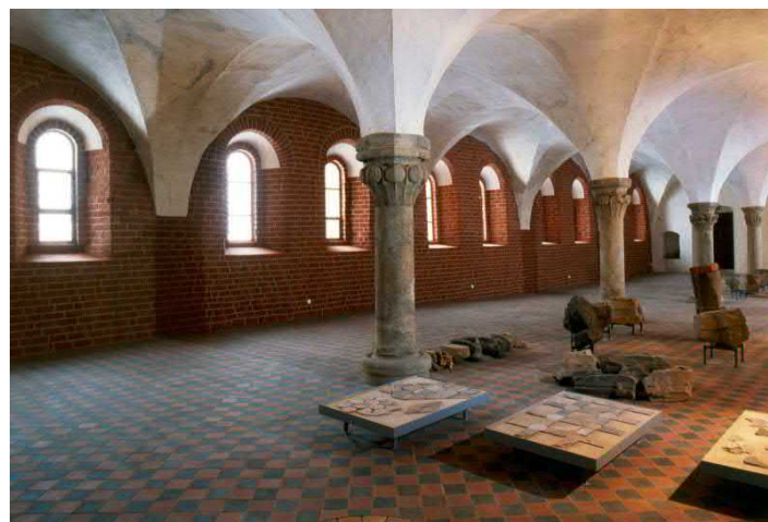
Refektorium der Konversen