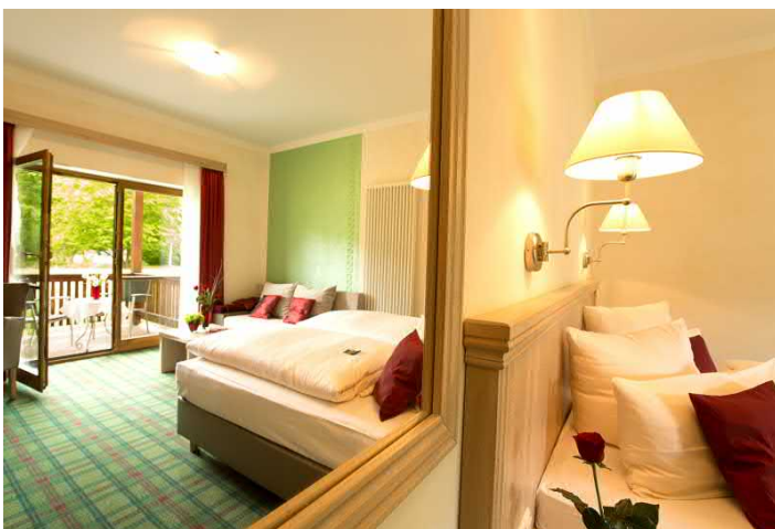
Zimmer im Hotel

ARRANGEMENT ganzjährig buchbar, Gesamtpreis 165,00 EUR p.P. inkl. 2 Übernachtungen im DZ 4-Sterne Kategorie mit Frühstück, 2 Abendessen und Wanderung, Gruppengröße 20 bis 30 Personen, 3-Sterne Gästehaus auf Anfrage. Zuschlag DZ in Einzelbelegung 60,00 EUR p.P. Touristische Infrastruktur: Parkplatz direkt am Klosterhotel. Barrierefrei.