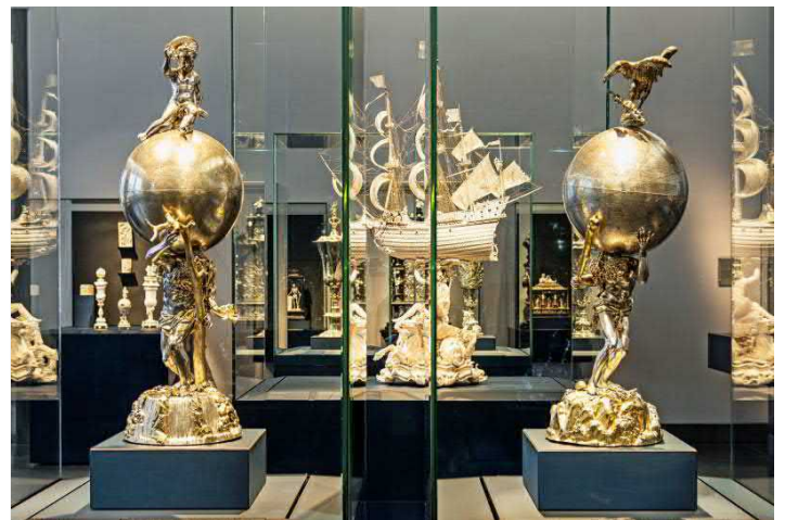
Neues Grünes Gewölbe