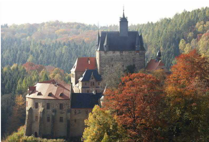
Burg Kriebstein im Herbst

FÜHRUNG buchbar von Februar bis November, Dauer ca. 1 h, Eintritt und Burgführung 7,50 EUR p.P. für Gruppen ab 15 Personen. Anmeldung erforderlich. Öffnungszeiten: Februar/März Di - So 10:00 - 16.00 Uhr, April - Oktober Di - Fr 10:00 - 17:00 Uhr, Sa/So 10:00 - 18:00 Uhr, November an Wochenenden und Feiertagen 10:00 - 16:00 Uhr. Führungen außerhalb der Öffnungszeiten nach Vereinbarung möglich. Busfahrer und Reiseleiter erhalten freien Eintritt. Optionale Buchung der Burgschänke »Zum Hungerturm« zur Verpflegung, geöffnet von Ostern bis Ende Oktober, Kapazität 40 Plätze. Touristische Infrastruktur: Großparkplatz für Busse an der Talsperre Kriebstein, Ausstiegsmöglichkeit Bushaltestelle Wendeschleife Kriebstein oberhalb des Burgberges, Fußweg ca. 10 min. Eingeschränkt barrierefrei.