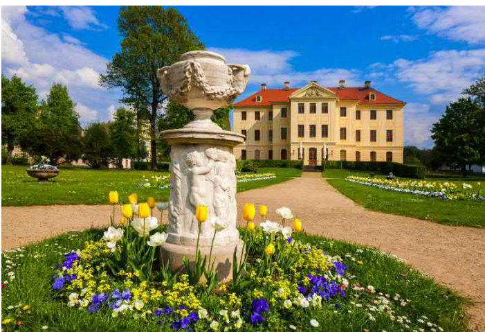
Barockgarten Zabeltitz mit Palais

ANGEBOT ganzjährig buchbar. Gruppengröße 10 bis 40 Personen. Komplettangebot 13,00 € p.P. Anmeldung erforderlich. Eintritt u. Führungen für Busfahrer und Reiseleiter frei. Auch Teilleistungen buchbar. Weitere Angebote auf Anfrage. Kostenfreier Busparkplatz direkt am Park. Eingeschränkt barrierefrei. Übernachtungsmöglichkeit in der Parkschanke Zabeltitz (3 Sterne, 13 DZ, 1 EZ, www.parkschaenke-zabeltitz.de )