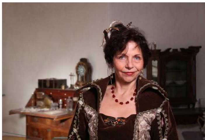
Gräfin Cosel im Coselturm