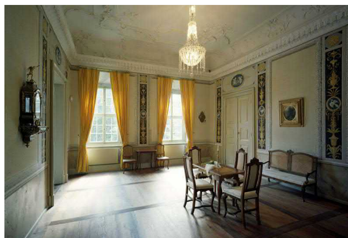
Das Goldene Zimmer