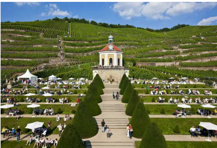
Das Belvedere von Schloss Wackerbarth

ANGEBOT ganzjährig buchbar. Wein- & Sekt-Führung mit 3er-Verkostung 12,00 EUR p. P. für Gruppen ab 15 Personen. Kostenfreie Teilnahme für Busfahrer und Reiseleiter. Optional mit saisonalem Mittag- oder Abendessen bzw. Kaffeetrinken kombinierbar. Weitere Angebote auf Anfrage. Touristische Infrastruktur: Haltemöglichkeit für Busse direkt vor der Manufaktur. Ausreichend Busparkplätze vorhanden. Barrierefrei.