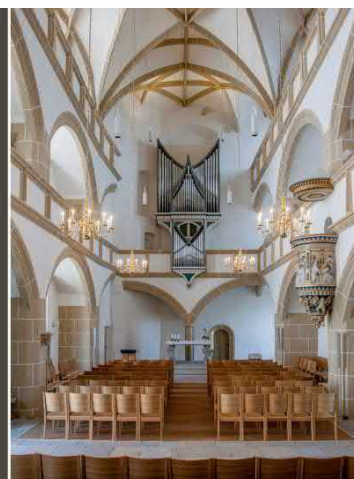
Evangelische Schlosskirche