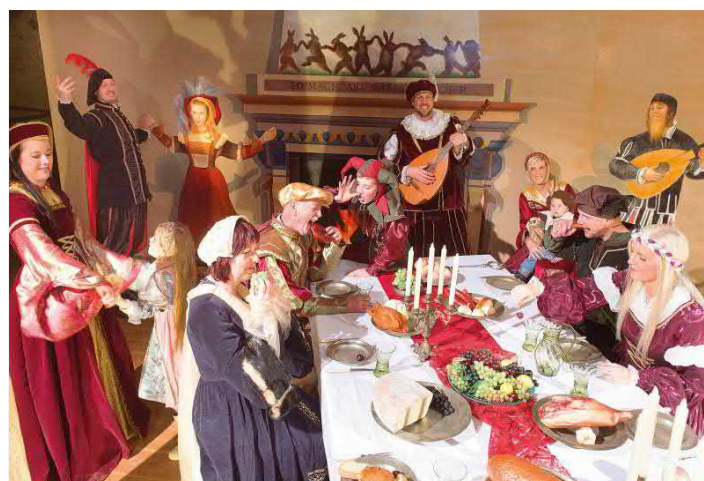
TIME WARP - Die total verrückte Renaissance Challenge, (c) ASL Schlossbetriebe gGmbH