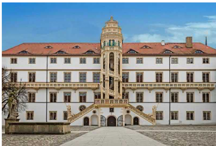
Schloss Hartenfels - Großer Wendelstein und Langer Gang

FÜHRUNG durch das Schloss und die Ausstellung »Schätze einer Fürstenehe« 2 h, 75 EUR/Gruppe bis 30 Personen, zzgl. Eintritt 3 EUR p. P. ; Eintritt Sonderausstellung ohne Führung 5 EUR p. P./ ermäßigt 4 EUR/ freier Eintritt bis 17 Jahre; Kurzführung Torgau 1 h, 50 EUR/Gruppe bis 30 Personen; Stadtführung 2 h, 75 EUR/Gruppe bis 30 Personen, zzgl. Eintritt 2 EUR p. P. für Bürgermeister-Haus oder Lapidarium Angebote für Kinder, Jugendliche; Museumspädagogik abrufbar