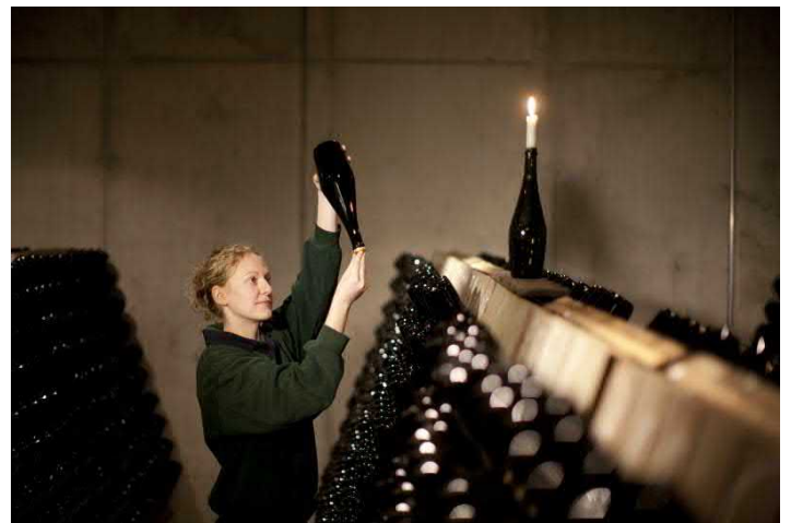
Schloss Wackerbarth führt die handwerkliche Kunst der traditionellen Flaschengärung meisterhaft fort.