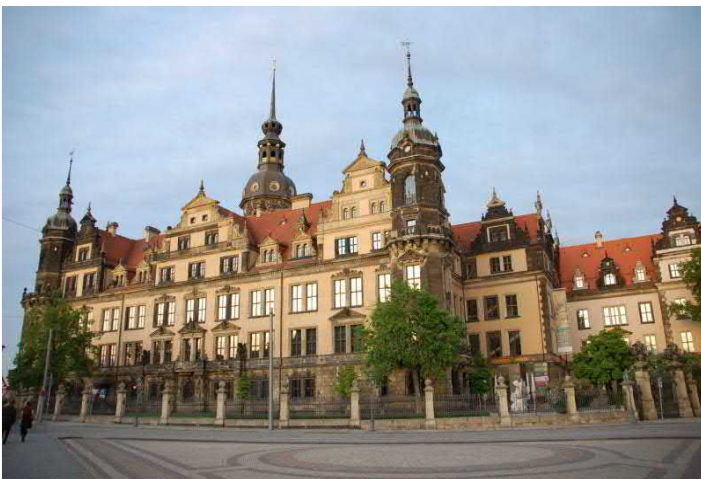
Residenzschloss, Foto: A. Malschewski, © SKD

FÜHRUNGEN ganzjährig buchbar (außer dienstags), Eintritt ab 11,00 EUR p.P., zuzüglich Führungsgebühr ab 90,00 EUR. Dauer ca. 1.5h, für Gruppen bis 25 Personen. Freier Eintritt für den Reiseleiter. Anmeldung erforderlich. Touristische Infrastruktur: Barrierefrei, außer im Hausmannsturm. Übernachtungen in der näheren Umgebung unter www.dresden.de/de/tourismus/buchen/uebernachtung.php .