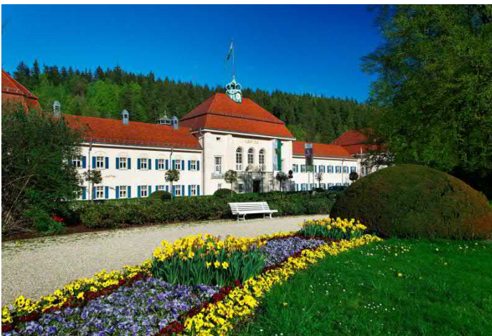
Das Albert Bad

FÜHRUNGEN ganzjährig und täglich buchbar. Historischer Stadtrundgang (ca. 2.5 h) Gruppen von 15 – 50 Pers: 95,20 EUR zzgl. Eintritt Sächsisches Bademuseum Bad Elster 3,00 EUR p.P. Voranmeldung erforderlich. Weitere Angebote, wie Besuch eines Konzertes, auf Anfrage. Freier Eintritt für Busfahrer und Reiseleiter. Touristische Infrastruktur: Busparkplätze am Ortseingang. Eingeschränkt barrierefrei. Übernachtungsmöglichkeit ab März 2016 im neueröffneten Hotel König Albert (4 Sterne, www.hotelkoenigalbert.de )