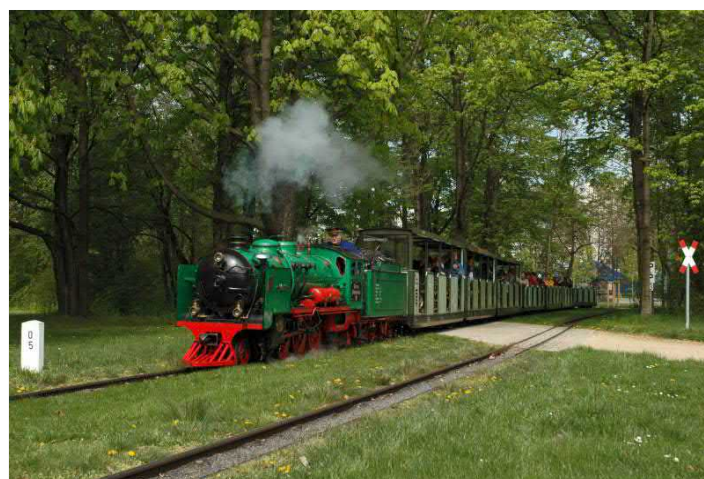
Parkeisenbahn im Großen Garten