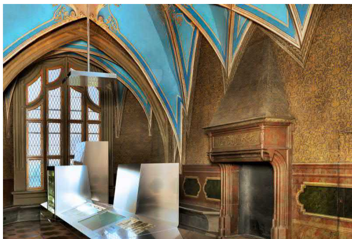
Trendsetter seit 1471

Eintritt, Besichtigung und Führung durch die Albrechtsburg Meissen und die Erlebniswelt HAUS MEISSEN® zum Gruppentarif (ab 15 Personen) 20,00 EUR p.P., inklusive betreuter Gästeführung 1h durch die Stadt Meißen zum jeweils anderen Objekt (Rundgang oder Busbegleitung). Beginn der Tour ist in der Albrechtsburg Meissen oder in der Erlebniswelt HAUS MEISSEN® möglich. Fremdsprachige Führungen auf Anfrage. Touristische Infrastruktur: Barrierefreier Zugang, Busparkplätze vorhanden.