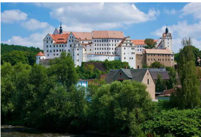
Schloss Colditz mit der Europa-Jugendherberge

ANREISE ganzjährig und täglich möglich (Weihnachten auf Anfrage), Paketpreis 82,00 EUR p.P. im MBZ, 92,00EUR p.P. im DZ, 102,00 EUR p.P. im EZ. Mindestteilnehmerzahl 10 Personen. Zuschlag für Vollpension (Mittagessen oder Lunchpaket) 6,00 EUR p.P./Mahlzeit, Reiseleiter und Busfahrer kostenfrei. Touristische Infrastruktur: behindertengerechte Zimmer, Fahrstuhl, Busparkplätze am Schloss. Barrierefrei.