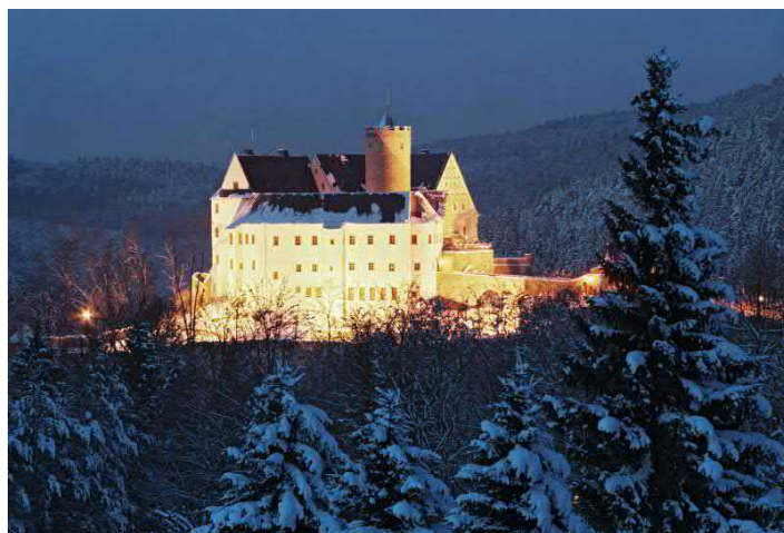
Burg Scharfenstein bei Nacht im Winter