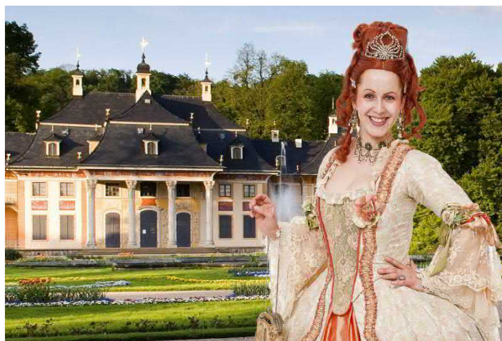
Führung mit gewandeter Schauspielerin