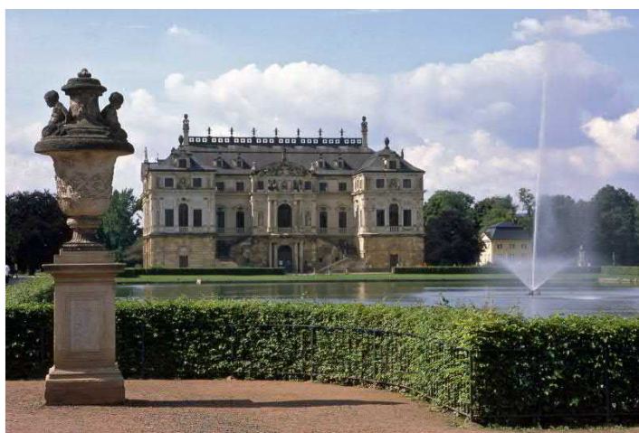
Schmuckplatz mit Palais im Großen Garten

FÜHRUNG inkl. Fahrticket und Eintritt Palais 9,00 EUR p.P, Kinder bis 15 Jahre 4,50 EUR p.P., zzgl. Führungsgebühr 30,00 EUR. Dauer ca. 2 h, Gruppengröße max. 30 Personen. Fahrseason Gründonnerstag - Oktober. Anmeldung erforderlich. Reiseleiter frei. Rundfahrten außerhalb der regulären Fahrzeiten zu Sondertarifen möglich. Weitere Angebote auf Nachfrage. Eingeschränkt barrierefrei. Übernachtungen in der näheren Umgebung unter www.dresden.de/de/tourismus/buchen/uebernachtung.php .