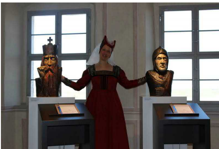
Die Hofmeisterin zwischen Friedrich von Schwaben (Barbarossa) und Wilhelm dem Einäugigen

ANGEBOT ganzjährig buchbar. 8 EUR p.P. (unter 15 Personen wird ein Pauschalbetrag von 120 € erhoben). Dauer ca. 1.5-2 h. Freier Eintritt für Busfahrer und Reiseleiter. Kostenfreier Busparkplatz (Markt Leisnig); kostenfreie PKW-Parkplätze unterhalb der Burganlage. Eingeschränkt barrierefrei. Exklusive Übernachtungsmöglichkeit im Hotel Kloster Nimbschen ( www.kloster-nimbschen.de , 40 Zimmer, 4 Sterne, 20km Entfernung)