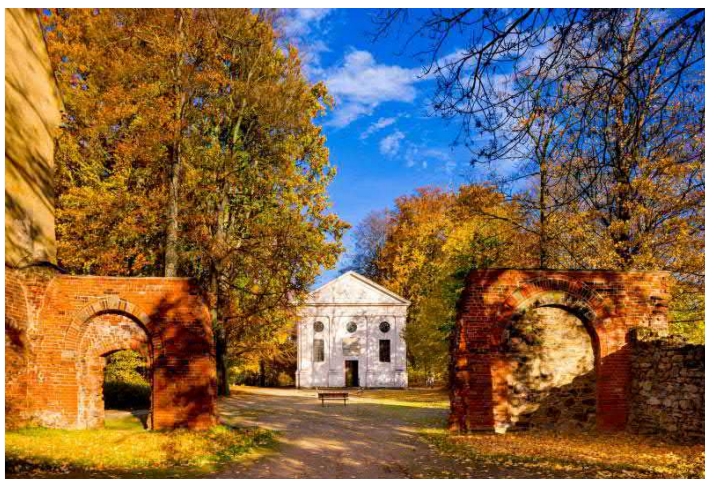
Das Mausoleum im Klosterpark Alzella

EINTRITT UND FÜHRUNG buchbar April bis Oktober, Dauer ca. 2.5 h. Preis für Eintritt, Führung und Verkostung 20,00 EUR p.P., Gruppengröße 15 bis 35 Personen. Anmeldung erforderlich. Freier Eintritt für Busfahrer und Reiseleiter. Weitere Angebote auf Anfrage. Touristische Infrastruktur: Parkplatz direkt im Klostergelände. Cafeteria im Servicebereich zum Klosterpark. Eingeschränkt barrierefrei. Übernachtungsmöglichkeit in der Klosterherberge »Fröhnerhaus«, direkt im Klosterareal ( www.kloster-altzella.de/de/klosterherberge ; 3EZ, 3DZ, 2MBZ, 25 Betten max.)