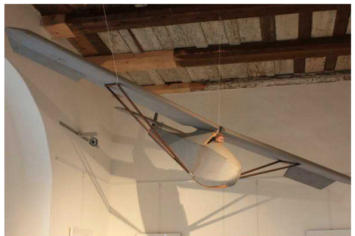
Fluchtsegler auf Schloss Colditz