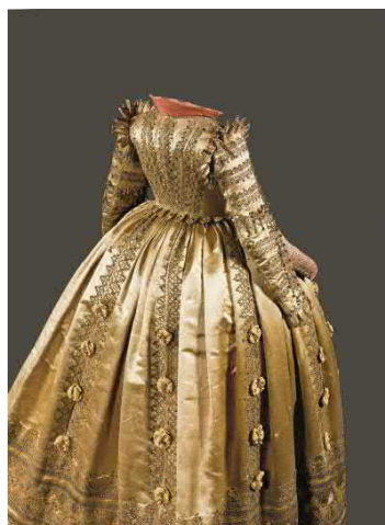
Prunkkleid der Kurfürstin Magdalena Sibylla v. Preußen