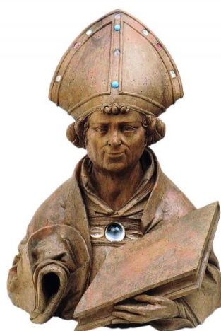
Büstenreliquiar des heiligen Benno, um 1525