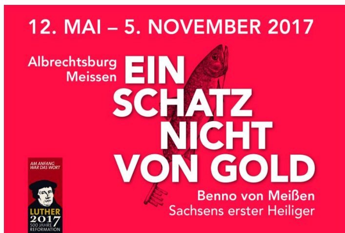
Ein Schatz nicht von Gold - Sonderausstellung Albrechtsburg Meissen

Eintritt, Besichtigung und Führung durch die Sonderausstellung und der Dauerausstellung der Albrechtsburg Meissen zum Gruppentarif von 9,50 EUR p. P. (mind.15 Personen)