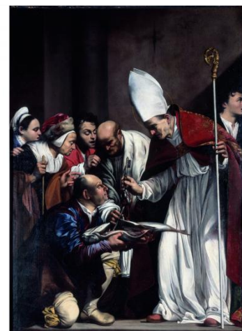
Fischwunder Bischof Bennos von Meissen