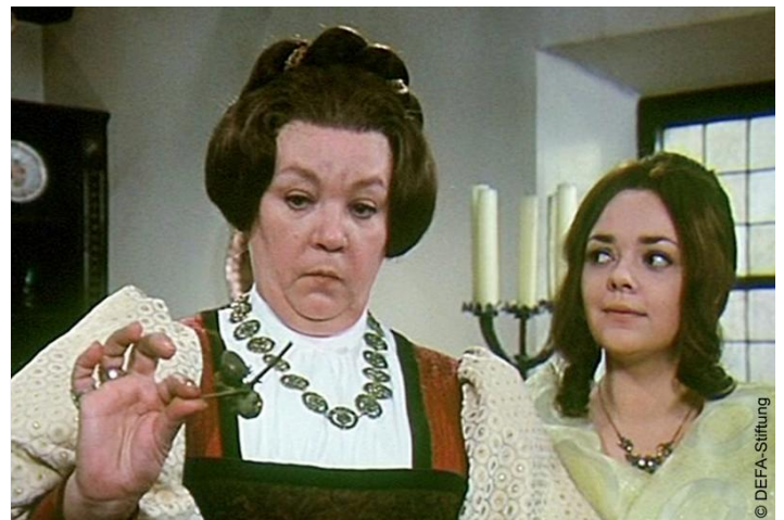
Filmszene aus »Drei Haselnüsse für Aschenbrödel«