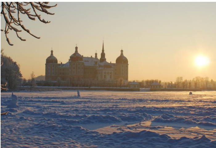
Königlich & Märchenhaft: Das Barockschloss Moritzburg

ANFAHRT mit Reisebus/PKW: A4 Abfahrt Dresden-Wilder Mann | A13 Abfahrt Radeburg (weiter nach Ausschilderung bis zum großen Parkplatz; nur 250m Fußweg zum Schloss)